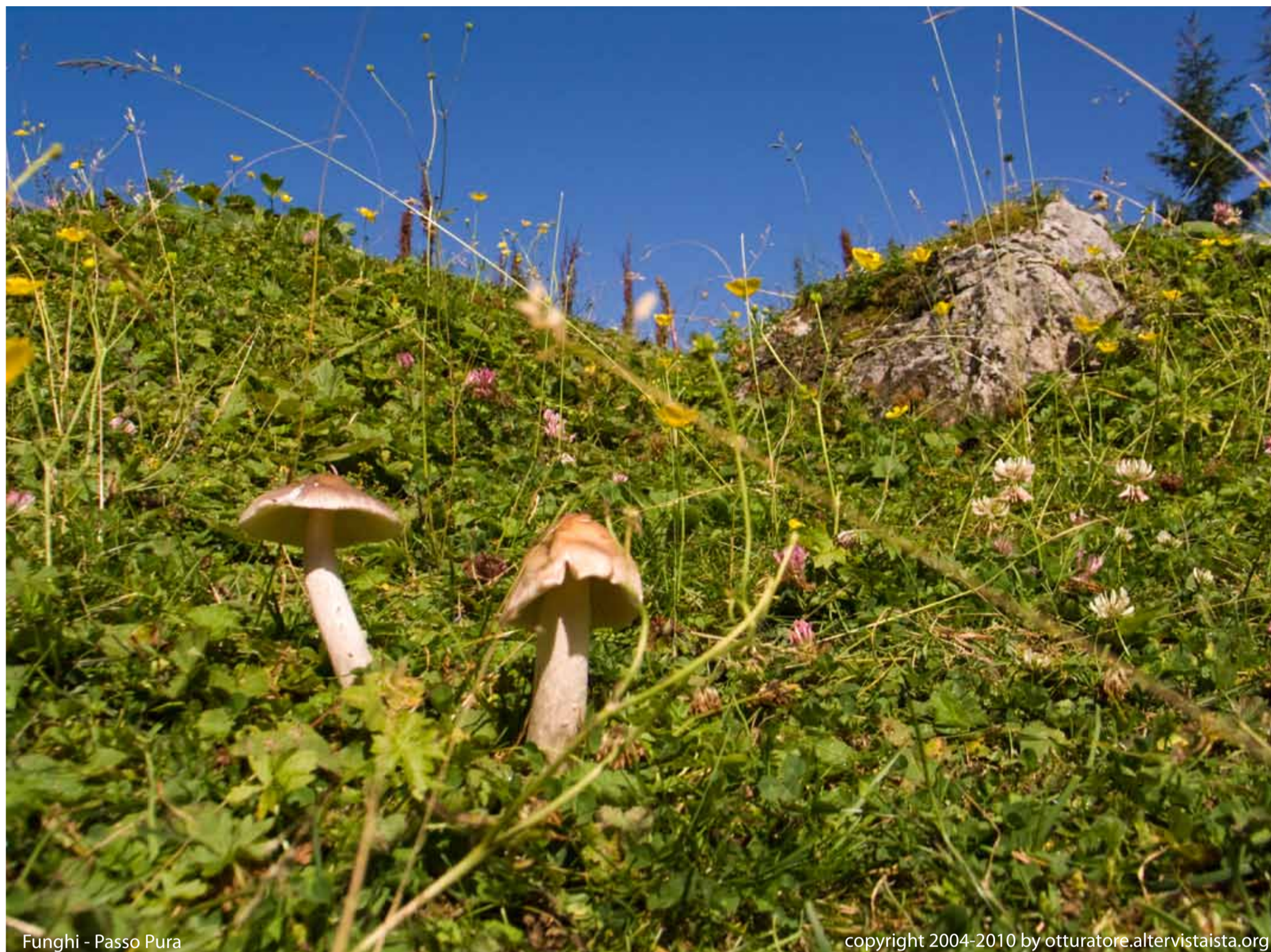
Funghi - Passo Pura