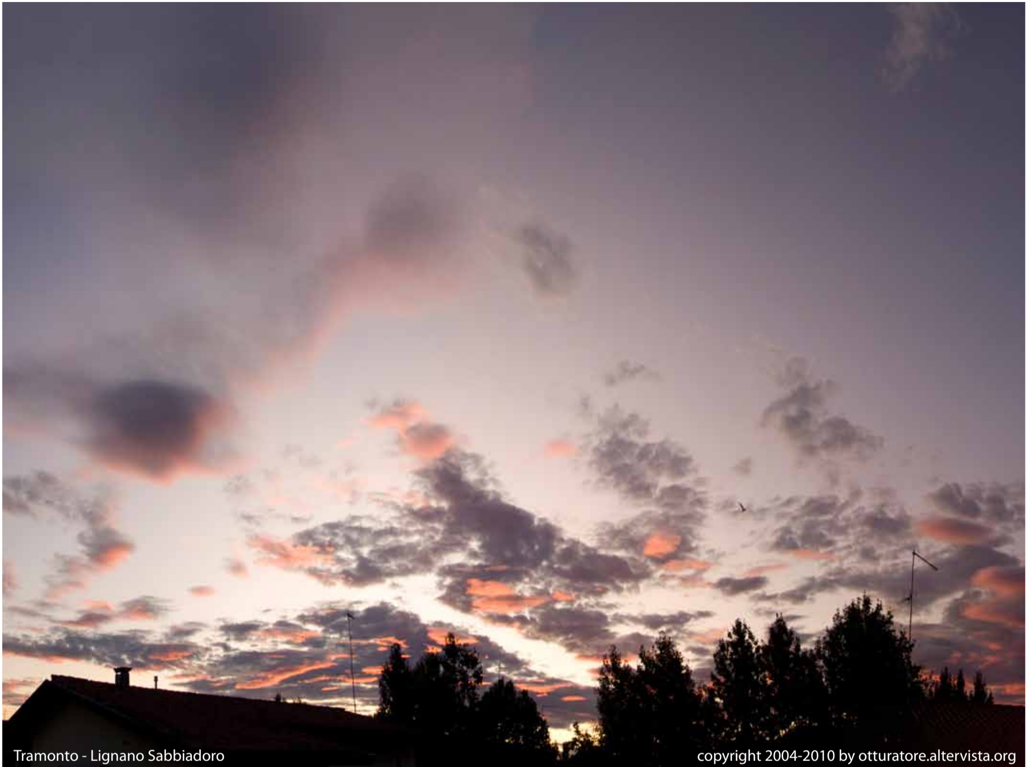
Tramonto - Lignano Sabbiadoro