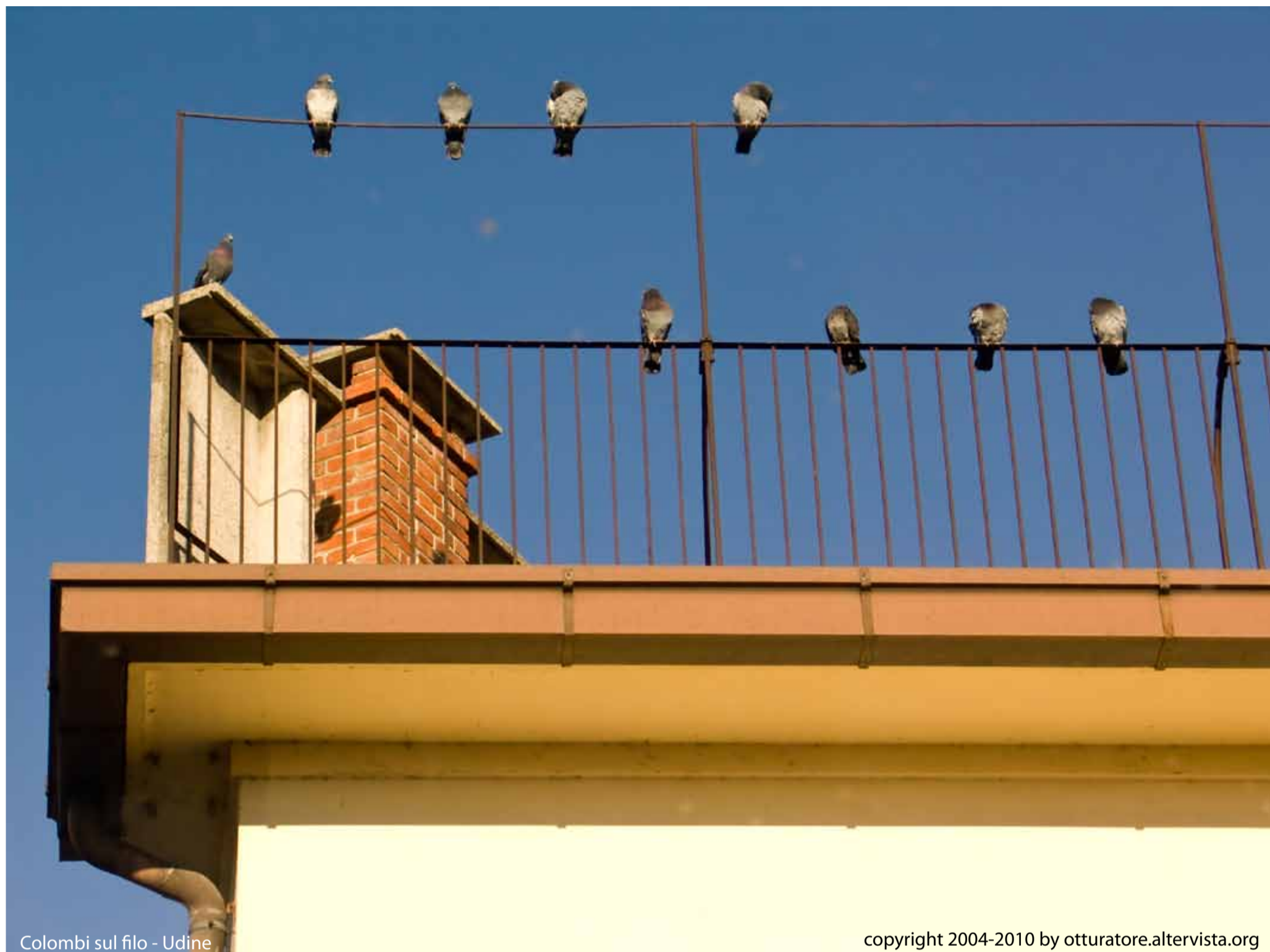
Colombi sul filo - Udine