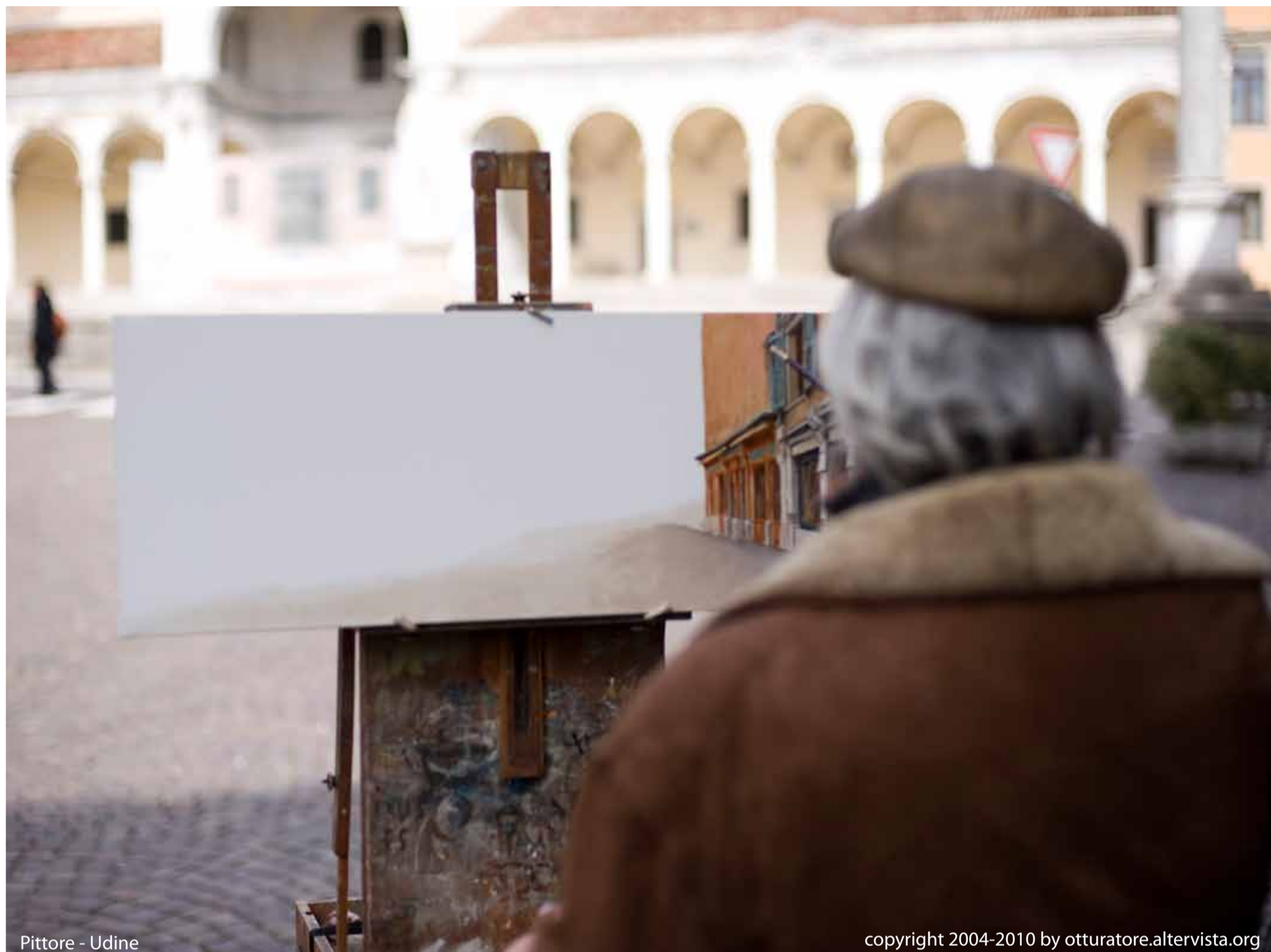
Pittore - Udine