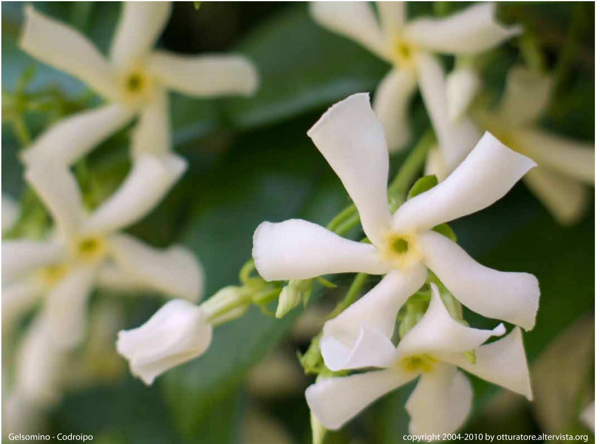
Gelsomino - Codroipo